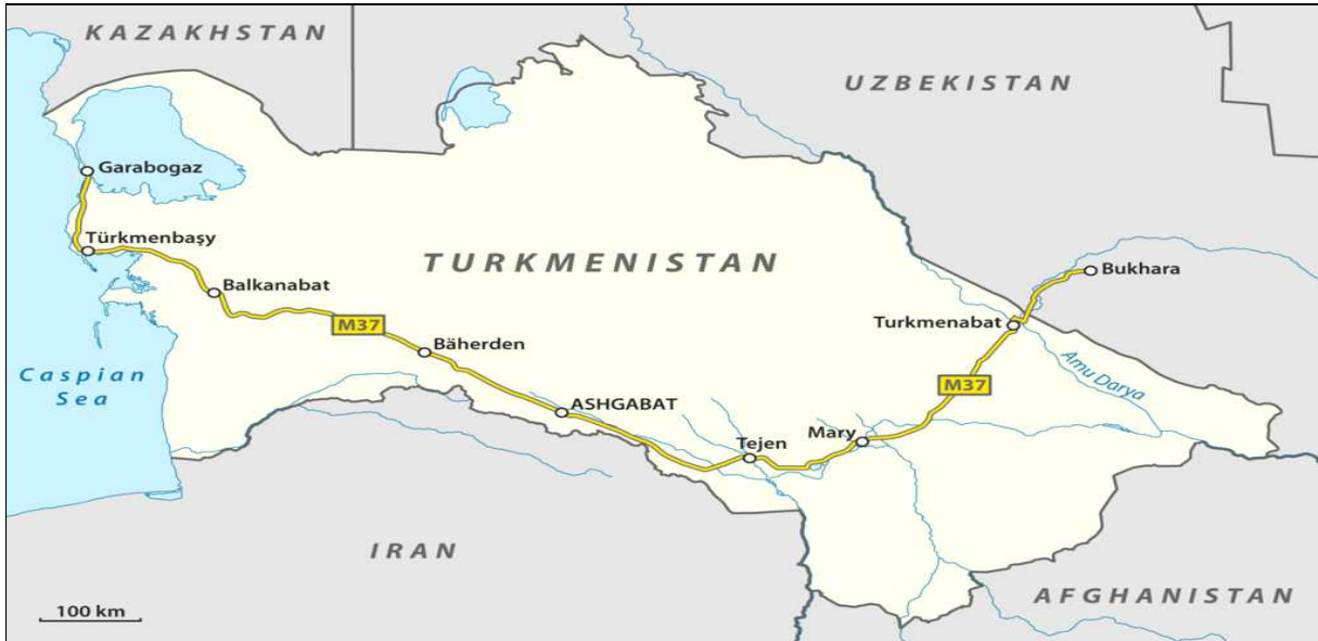
그림 1. 투르크멘바쉬-아쉬하바드-투르크메나바트 고속도로 건설