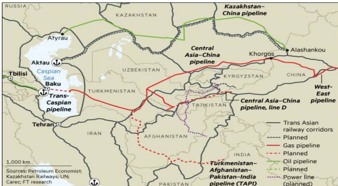
그림 2. 중앙아시아-중국 가스관 및 TAPI 가스관